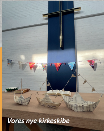
Vores nye kirkeskibe