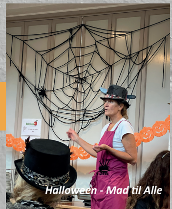
Halloween - Mad til Alle