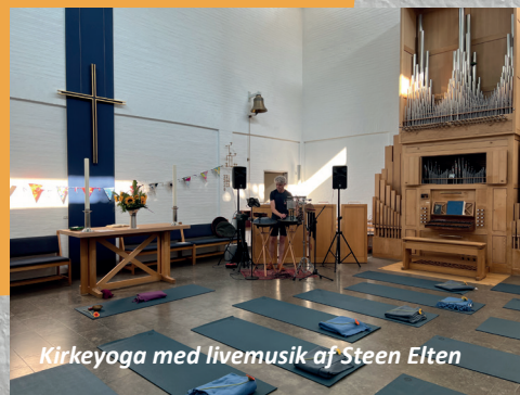
Kirkeyoga med livemusik af Steen Elten