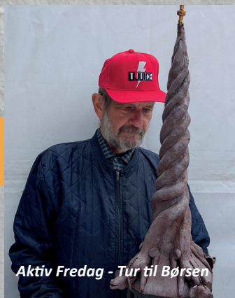
Aktiv Fredag - Tur til Børsen